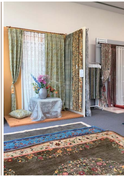
前回の展示会場の様子

いちご泥棒やケルムスコットツリーなどの様々なデザインのカーテン生地を展示します。織物とプリントコットンの2種類あり、色使いや手触りなど違った印象なので是非触って見てください。